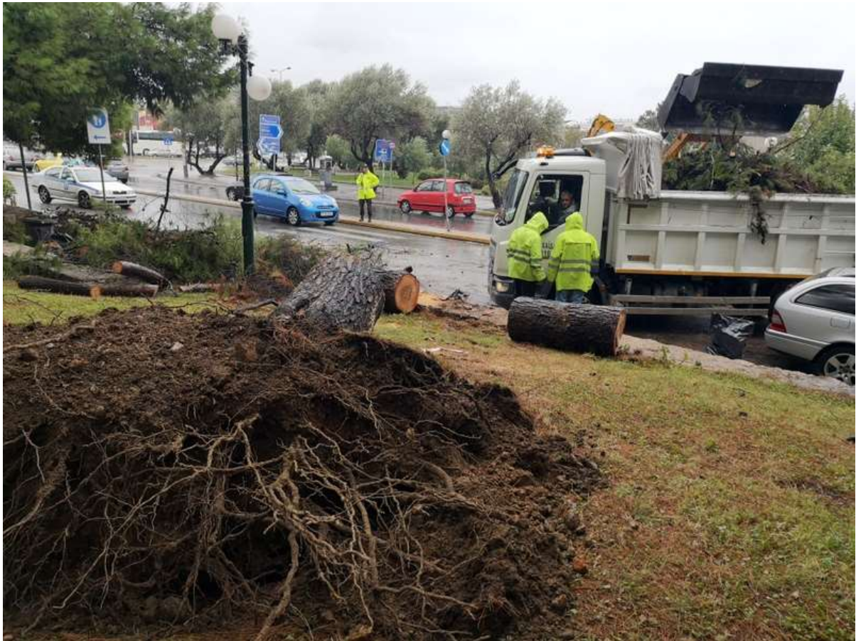
Παλατάκι. Ξεριζώθηκε στην πρόσφατη κακοκαιρία.