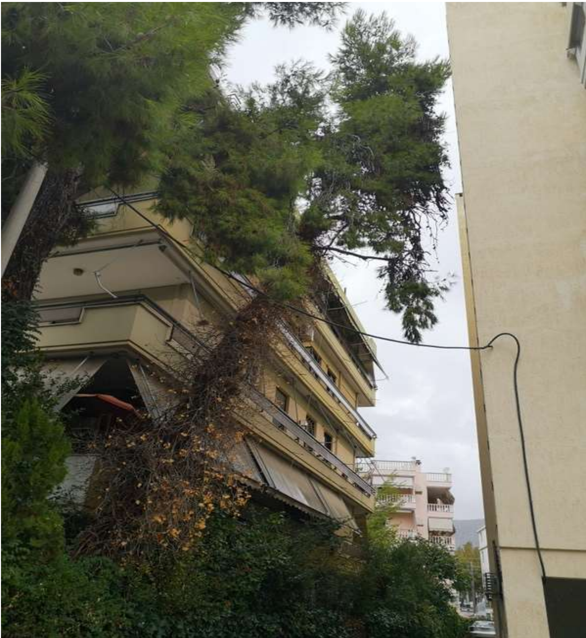
Κουνέλια, ψάχνοντας φως ανάμεσα σε δύο πολυκατοικίες. Η κώμη κουρεμένη ψηλά δημιουργεί πρόβλημα ευστάθειας.

Ο κ. Παρισινός τονίζει ότι απαιτούνται προσεκτικά βήματα. “Πρώτα πρώτα απαιτείται διαχειριστική μελέτη, συνολικά για όλους τους κοινόχρηστους χώρους πρασίνου του Δήμου. Αυτή γίνεται ακόμη και στο δάσος, πόσο μάλλον σε αστικά πάρκα και άλση. Πρέπει να ξέρεις τη σύσταση του χώματος, πού περνούν σωλήνες κτλ. Αλλιώς πας στα τυφλά και πάλι θα προκύψουν προβλήματα”.